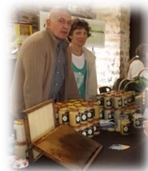
Le Ruché de Boissy