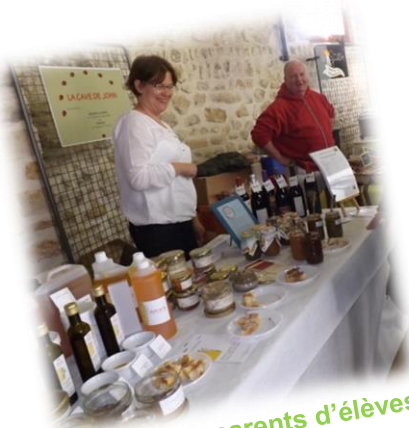
Stand des parents d'élèves

Vous étiez en vacances, vous en avez entendu parlé et/ou vous avez oublié de prendre l'annuaire ? Pas de problème, petit mémo des exposants présents.