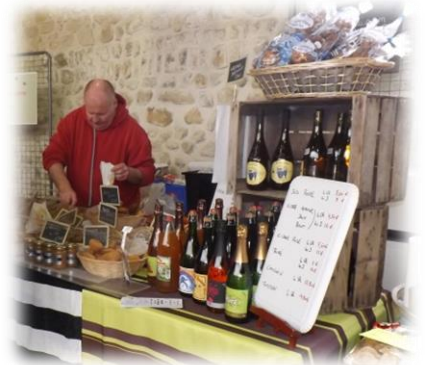
Alain Deygas Produits Bretons