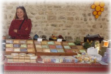
La Ronde des Savons