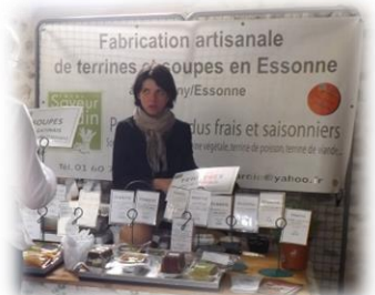
Entre Saveurs et Jardins