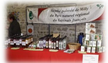
La Ferme du clos d'Artois