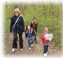
A la recherche du fil rouge ...

Un nouveau parcours, des nouvelles questions, de quoi ravir petits et grands. Le temps était avec nous et les déchets aussi !!!!