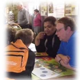
Merci au SIREDOM d'avoir été présent lors de cette journée.