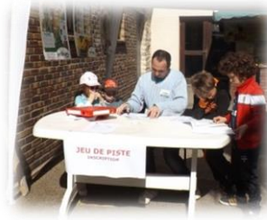
Table de départ ...