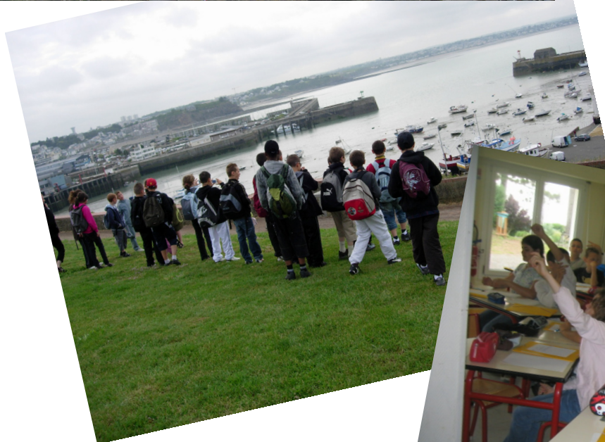
Le port de Granville.