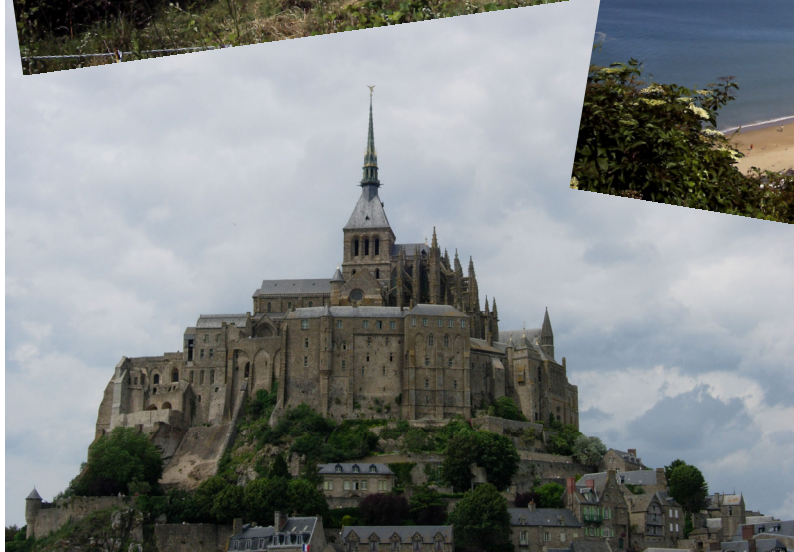
Le Mont Saint Michel