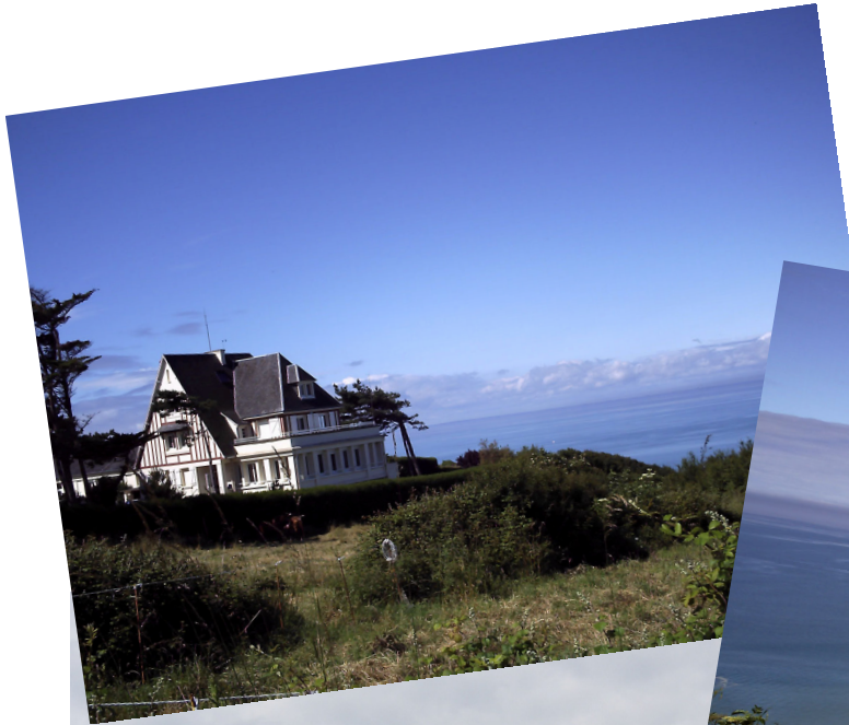
La villa EOLE ...

... et la magnifique vue sur la plage à partir de la Villa Eole.