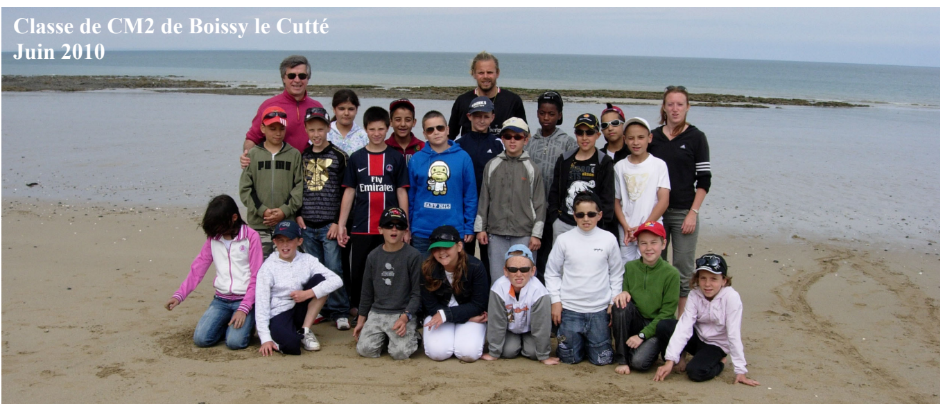
Classe de CM2 de Boissy le Cutté Juin 2010